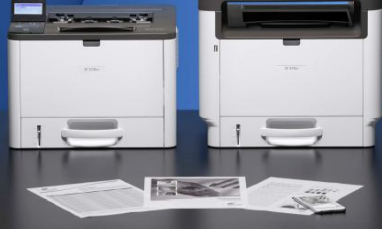
SP 3710SF 34 ppm monocromática SP 3710DN 34 ppm monocromática