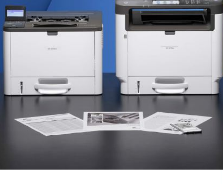
SP 3710SF 34 ppm