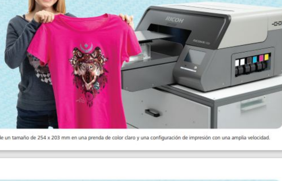
* Test de velocidad realizado utilizando un gráfico de un tamaño de 254 x 203 mm en una prenda de color claro y una configuración de impresión con una amplia velocidad.

Diseñada para un uso fácil y un mantenimiento mínimo, la Ri 1000 está lista para imprimir en tan solo unos minutos tras el arranque. Las opciones de limpieza personalizadas te permiten seguir imprimiendo a gran velocidad durante más tiempo.